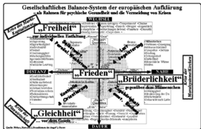
Bild 3: Werte-balanciertes Gesellschaftssystem der europäischen Aufklärung

Das Wichtigste aber ist die Erkenntnis, dass all dies Wissen nur dann praktisch etwas nützt, wenn man daraus Handlungskonsequenzen für den eigenen Lebensstil ableitet und zunehmend danach handelt. Wie sagte Erich Kästner doch so schön: „Es gibt nichts Gutes , ...“. Kein Zweifel: Achtsamkeit und Selbstdisziplin sind für eine entsprechende Selbststeuerung günstige Basiskompetenzen.