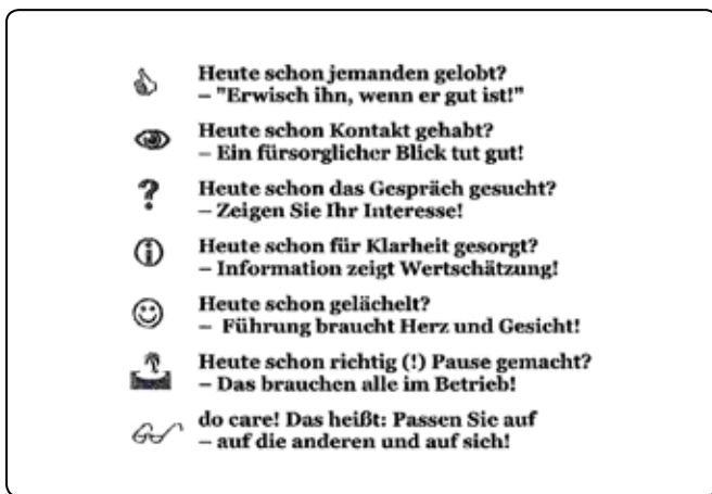
Bild 7 b: „Care Card“ für FK zum täglichen Selbstcheck [Matyssek 2011]