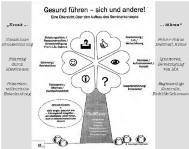
Bild 7 a: „Kleeblatt“ zur gesunden Mitarbeiterführung [Matyssek 2011, Fittkau u.a. 2009]