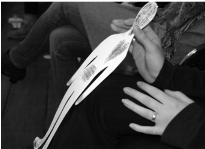
Abb. 1: Stärken – Schwächen.