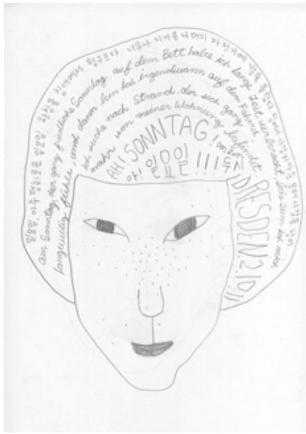
Ich-Buch, Sonntag in Dresden